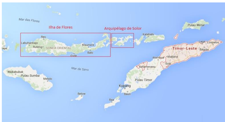
Figura 2: Mapa dos arredores de Timor-Leste. A Ilhas de Flores e Solor foram parte do território português durante o período colonial, até meados do século XIX, quando foram vendidas à Holanda.