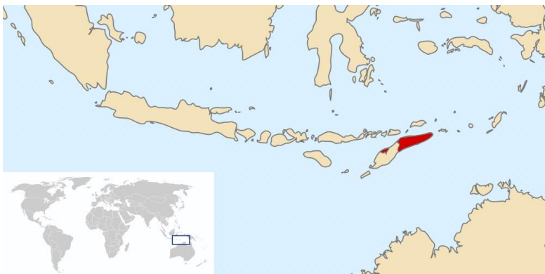
Figura 1: Localização de Timor-Leste no globo.

A República Democrática de Timor Lorosa'e (RDTL), ou simplesmente Timor-Leste, é um dos países que mais recentemente teve sua independência, após uma longa história de conflitos e conquistas. O país ocupa a parte oriental da Ilha de Timor, no sudoeste asiático, região de limite entre o Oceano Índico e Pacífico (Figura 1), e foi inicialmente colonizado por portugueses que lá aportaram nas primeiras décadas do século XVI.